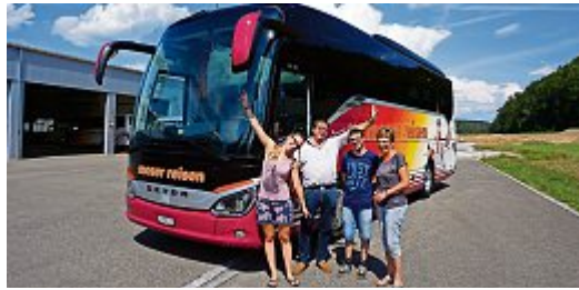
Das «Moser»-Team freut sich auf zahlreiche Gäste in Flaach.

Einmal im Jahr begrüßen wir Gäste von überall in Flaach am 24. Februar in der Worbighalle, um unsere erlebnisreichen Reisen in ganz Europa für das laufende Jahr zu präsentieren.